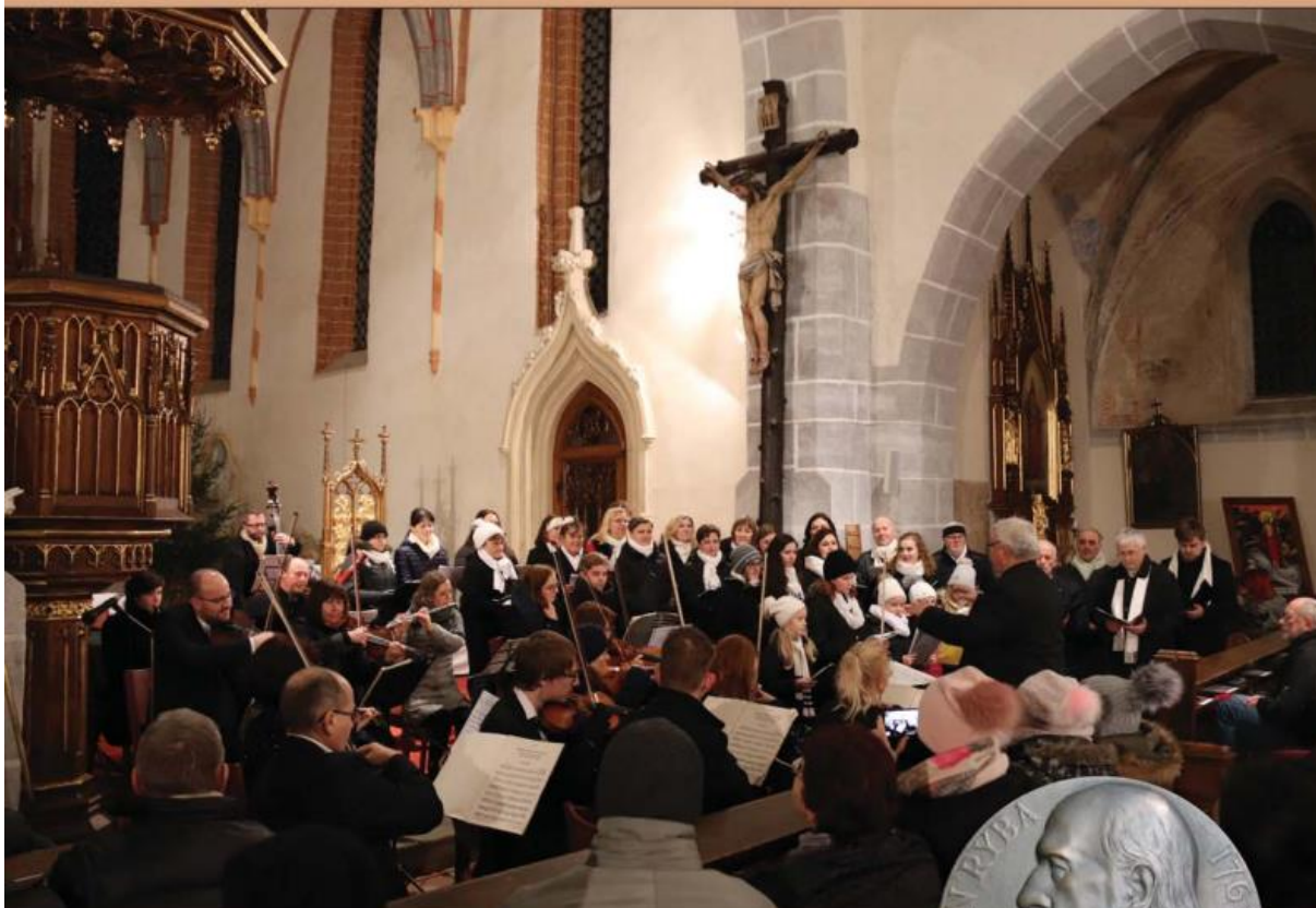
Česká mše vánoční v Nepomuku – rok 2018, foto Pavel Motejzík